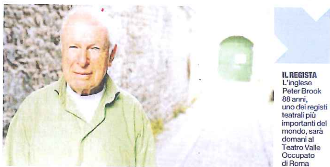
IL REGISTA L'inglese Peter Brook 88 anni, uno dei registi teatrali più importanti del mondo, sarà domani al Teatro Valle Occupato di Roma

Domani nello spazio occupato anche il film del figlio Simon