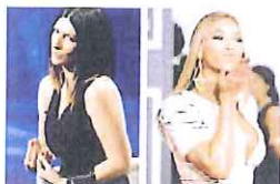
Laura Pausini e Beyoncé

ROMA — L'appuntamento è per il 1° giugno, a Londra, allo stadio di Twickenham. Il titolo è "The sound of change live". Il cast è straordinario, da Beyoncé a Florence+the Machine, da Timbaland a Ellie Goulding, da John Legend a Rita Ora, da Haim a Iggy Azalea e anche ad una grande star italiana, Laura Pausini. L'occasione è promuovere "Chime for Change", progetto sostenuto da Gucci e promosso dalle Nazioni Unite, per ricavare fondi in favore delle associazioni che sono impegnate nel campo dell'istruzione e della salute delle donne. È stato l'ex premier britannico Gordon Brown, incaricato dall'Onu, a presentare il progetto a Cannes, nel corso della presentazione della campagna "Global Education First Initiative", per la quale Brown ha chiesto l'impegno dell'intero sistema televisivo internazionale: «61 milioni di bambini non ricevono alcuna forma di istruzione. Questa è una delle grandi questioni che riguardano i diritti civili nei nostri tempi».