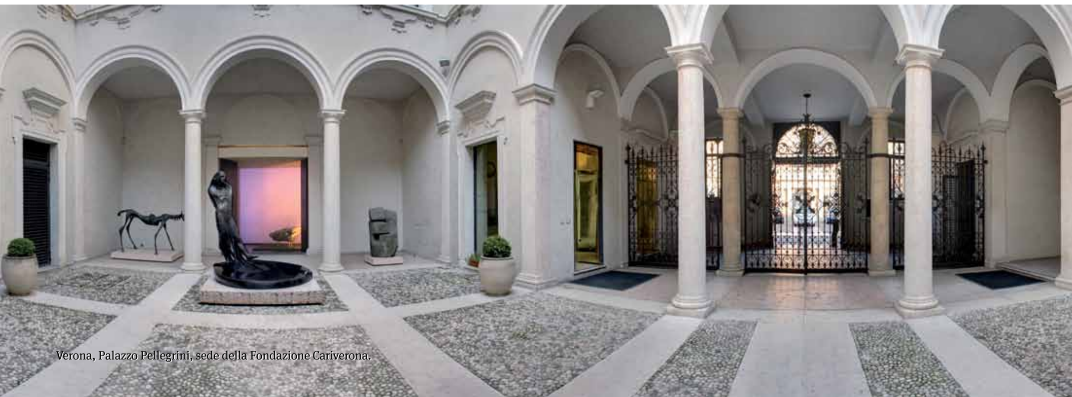
Verona, Palazzo Pellegrini, sede della Fondazione Cariverona.

Il Teatro Ristori torna quindi all'attività con la Stagione 2012 che viene qui illustrata.