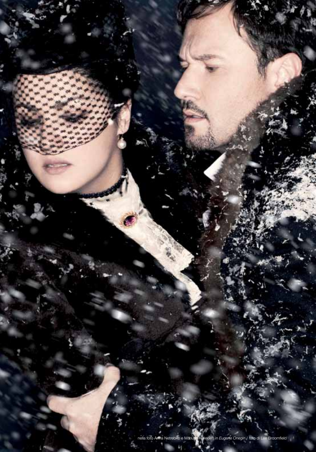
nella foto Anna Netrebko e Mariusz Kwiecien in Eugene Onegin