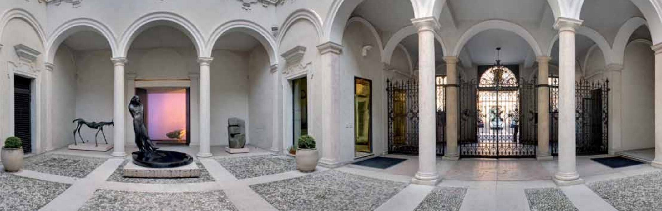
Verona, Palazzo Pellegrini, sede della Fondazione Cariverona.